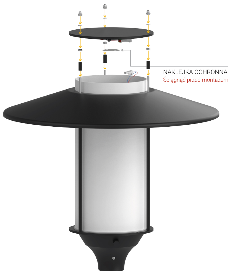
PRAWIDŁOWY MONTAŻ DASZKU