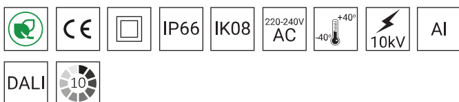
TABELLA DELLE VARIANTI